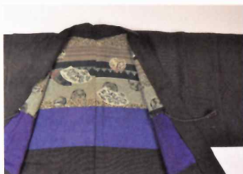
明治から昭和初期まで、隆盛を誇った「甲斐絹」は、「粋」な装いとして楽しまれた