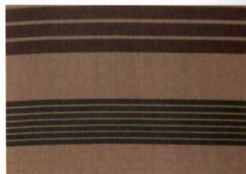
甲斐絹ミュージアムより 縞甲斐絹 【大正3年】製作者：谷村町 平井国太郎