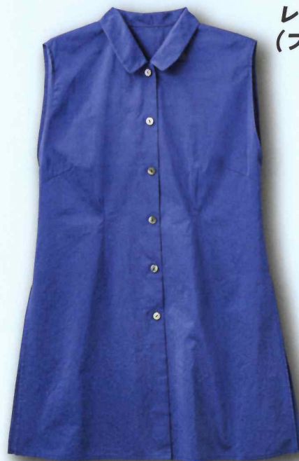
レディースシャツ (ブルー)