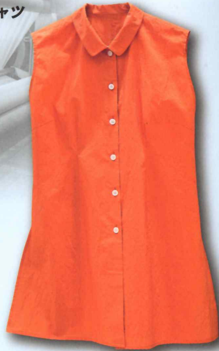
レディースシャツ (オレンジ)