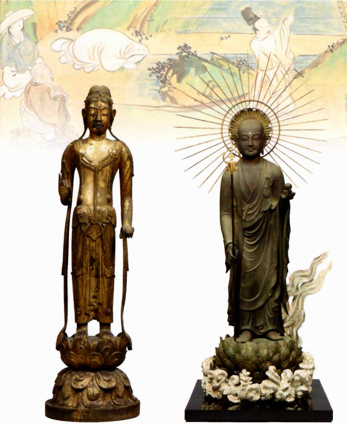
重要文化財 普賢菩薩立像(六観音のうち) 飛鳥時代 法隆寺 画像提供:奈良国立博物館