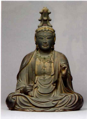
奈良県指定文化財 文殊菩薩騎獅像 鎌倉時代 法華寺