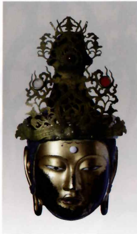
奈良県指定文化財 菩薩面(来迎会所用面) 室町時代 當麻寺