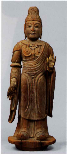
天部形立像(伝帝釈天) 平安時代 唐招提寺

本展では、奈良大和路に伝来する仏像をはじめとした絵画や工芸品の数々とともに、奈良を愛した写真家・入江泰吉の風景写真もご紹介いたします。文士たちの言葉に誘われ、さながら巡礼をするかのように、奈良大和路の魅力をご堪能ください。