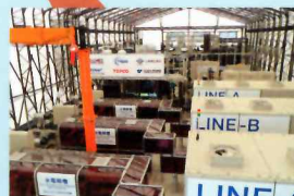
県企業局 米倉山電力貯蔵技術研究サイト