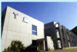
山梨大学 水素・燃料電池ナノ材料研究センター