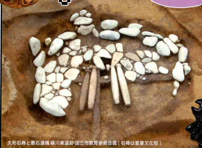
大形石棒と敷石遺構 緑川東遺跡 国立市教育委員会蔵 [石棒は重要文化財]