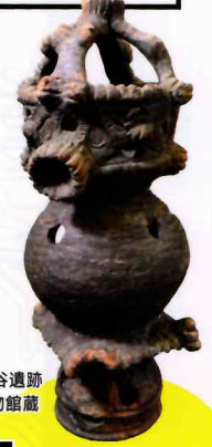
埼玉県指定文化財 異形台付土器 雅楽谷遺跡 さきたま史跡の博物館蔵