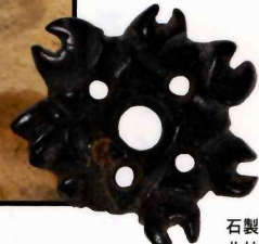
石製装身具 青木遺跡 北杜市教育委員会蔵