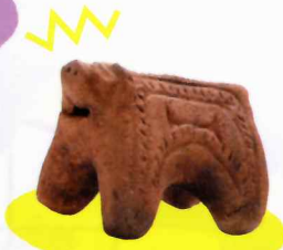
イノシシ形土製品 井野長割遺跡 佐倉市蔵