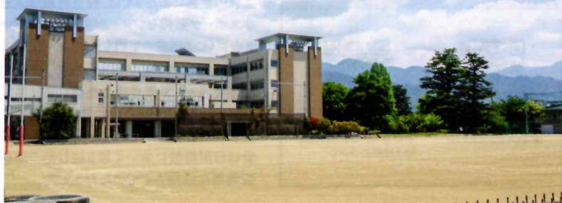
現在の日川高校グラウンド