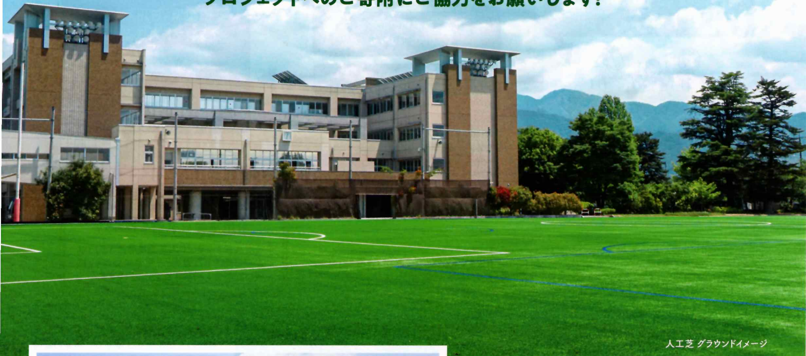
人工芝 グラウンドイメージ