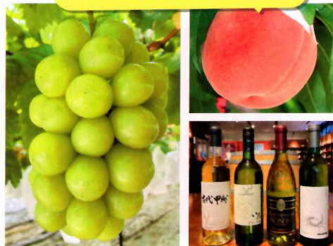
ふるさと納税返礼品の一例

※個人の方でインターネットからのご寄附が難しい場合は、紙の寄附申出書によるご寄附のお申し込み方法をご案内しますので、お問い合わせください。