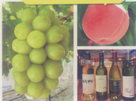
ふるさと納税返礼品の一例

※個人の方でインターネットからのご寄附が難しい場合は、紙の寄附申出書によるご寄附のお申し込み方法をご案内しますので、お問い合わせください。