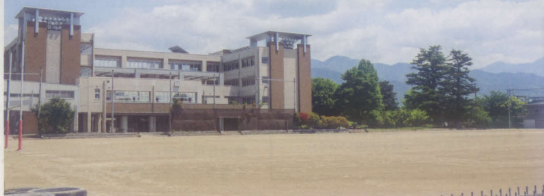
現在の日川高校グラウンド