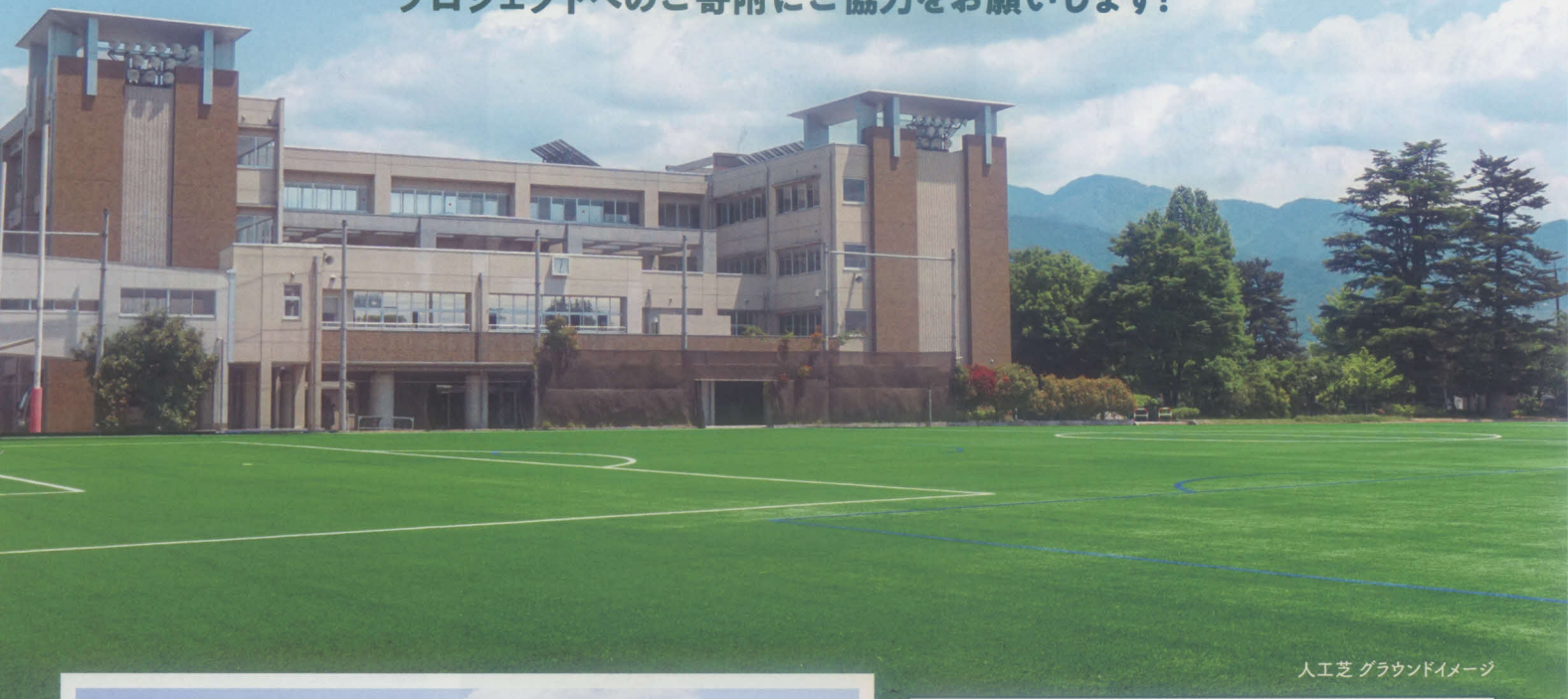
人工芝グラウンドイメージ

～第1弾!!日川高校グラウンド人工芝生化!～ プロジェクトへのご寄附にご協力をお願いします!